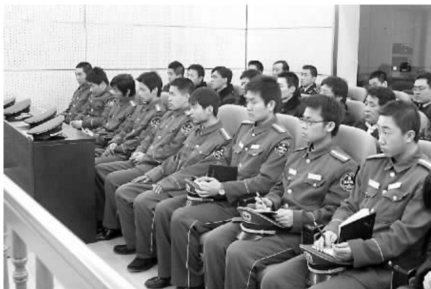
北京市门头沟区保安公司的保安受邀旁听庭审。

近年来,西城区法院在坚持宽严相济的刑事政策基础上,努力创新未成年人审判工作机制,认真落实“教育、感化、挽救”的方针。法官们倾注自己的