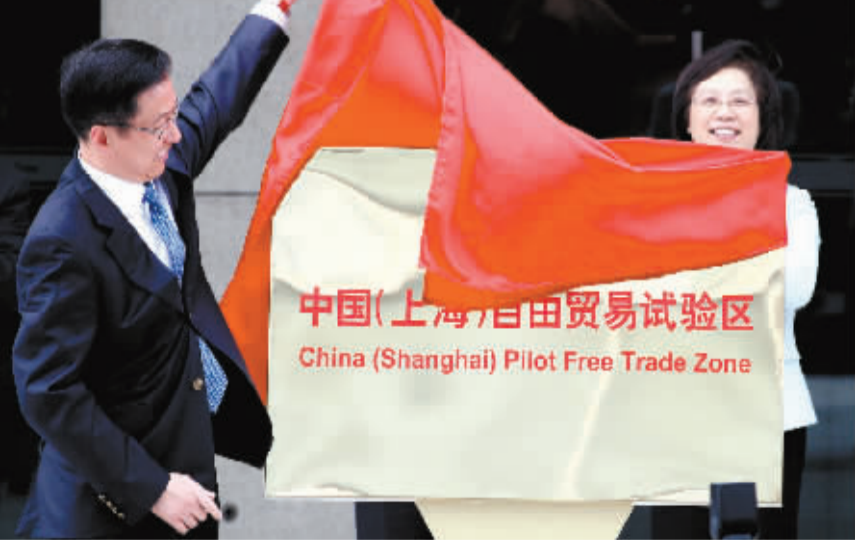
9月29日，中国（上海）自由贸易试验区挂牌仪式在上海外高桥保税区举行。韩正、杨雄、高虎城等出席挂牌仪式。现场为36家企业颁发证照，其中11家为中外合资、外商独资企业。

据统计，今年截至目前，全国查办的仅涉及散布或传播飞机“炸弹”信息的案件就达80余起。与一般谣言不同，虚假恐怖信息的传播速度更快、危害后果更大，民众对此深恶痛绝。然而，由于刑法的相关规定过于笼统和缺乏可操作性，导致各地在执行中存在尺度不一、打击