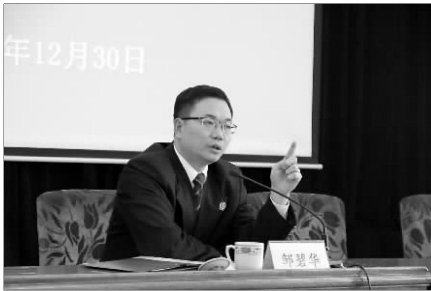
邹碧华在向全院法官讲解“要件审判九步法”。

邹碧华:总的特点可以概括为三个“基本”,三个“连接点”。三个“基本”,即以请求权和抗辩权基础作为法律适用的基本出发点,以法律规范构成要件作为审判的基本元素,以简明具体的操作步骤作为抽象审判思路的基本载体;三个“连接点”,即在程序法和实体法之间建立连接点,在纠纷事实与法律规范构成要件之间